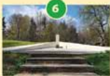
Oklo nad Ihanom