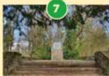
Judeževa domačija, razvaline