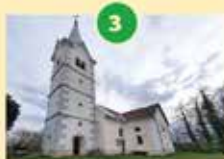
Cerkev Sv. Kungunde, Tabor nad Ihanom