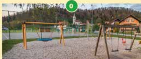
Športni park Ihan