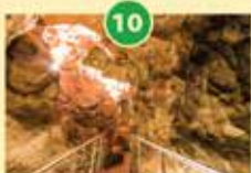
Železna jama in jamarski muzej