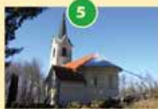
Cerkev Sv. Miklavža na Goropečah