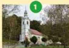
Cerkev Sv. Jurija