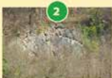
Kamnolom ihanskega marmorja