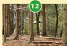
Veliki vrh nad Ihanom – Križentaver